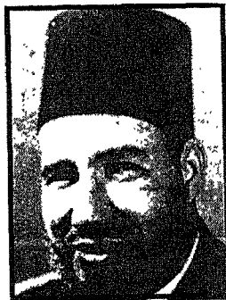
Hssan al- Banna

The movement initiated by Rashid Rida, which